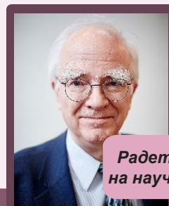
Филип Грандъен (Philippe Grandjean)

Набляга на разбирането за надеждни резултати от научните изследвания в нашето основано на знания общество