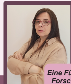
Eine Fürsprecherin der Forschungsintegrität